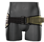
MILITAR VERDE MILITAR/ NEGRO